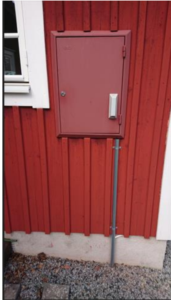
Elskabet , hvor elmåler mm. er placeret:

NB: Den grå boks på elskabet er EON's modul til SMS-aflæsning af elforbruget. Forbruget kan følges dagligt i EON's app.