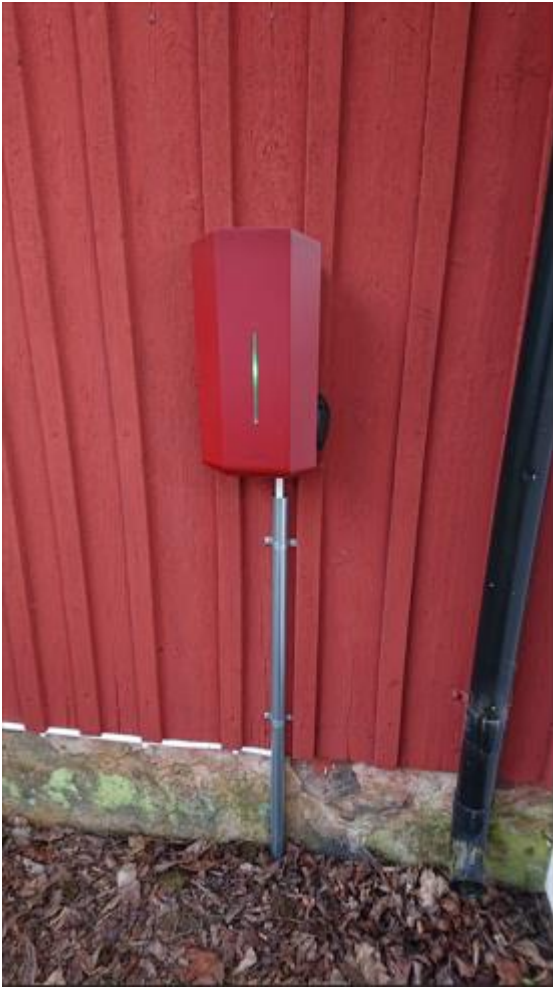
Ladeboksen ved indgangen til fritidshuset:

Det løse ladekabel tilkobles ladeboksen nederst til højre.